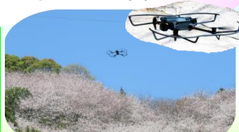
全景撮影中のドローン

生石地区まちづくり協議会では発足当初から力を入れて整備してきた垣生山。ゆかりのある陽光桜など、桜のきれいな時期に、垣生山全体のドローン撮影を行い、編集後10周年記念式典でお披露目した後、一般公開も行う予定です。