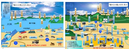
東西に設置されている展望図