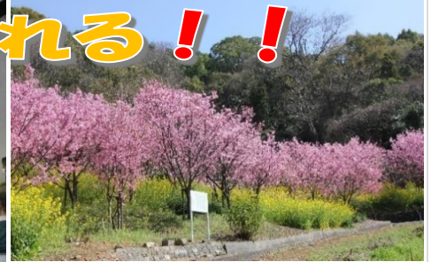
北吉田町側の陽光桜(2023. 3. 22撮影)

また、松山市の有形文化財である「掩体壕」の委託管理業務は当教育文化部が中心となって、平和について若い世代に語り繋いでいく活動を行っています。今年、松山