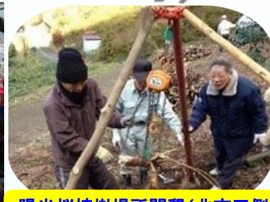
陽光桜植樹場所開墾(北吉田側) (2013年11月撮影)

生石地区まちづくり協議会は、来年発足後10年の節目を迎えます。当協議会では生石地区のシンボル、垣生山の里山化をめざして取り組んできました。地権者さまのご理解、ご協力を得て、高岡側、北吉田側の登山道入り口付近の一角に陽光桜を植樹して、いまでは見事な花を咲かすまでに成長。ここ3年あまりはコロナ禍で閉ざされた日常をエンジョイすべく、垣生山に足を運ぶことを日課？としている近隣地域の皆さんを始め、山頂からの眺望を求めて訪れる地区外からの登山者も多く、気軽にカメラ片手に登れる人気のスポットとなっています。