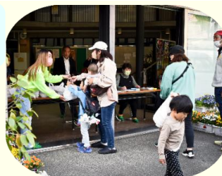
弁当を受け取りに訪れた申込み者

福祉部では「ふれあい食堂」の一環として「湯築ライオンズクラブ」のご協力のもと、弁当50食を配付しました。今回はプレイベントのため、生石保育園に通っている親子を対象に希望者を募集し、4月27日(木)午後5時から生石公民館に会場を設けて申し込みをされていた方にお渡ししました。好評でしたので、第2弾として「ハートランチ」に弁当を作ってください、5月25日(木)午後5時から41食を配付(大人は有償)しました。