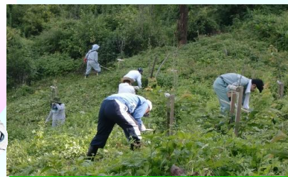
陽光桜植樹部草刈り(北吉田側) (2014年7月12日撮影)