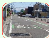
ベルモニー会館横

生石地区の各指定区域は右記図の通りですが、30キロを超えて走行する車が大変多く見受けられます。指定区域では速度制限を守り、思いやりのある運転を心がけたいものです。また、「うっかりドライバーへの有効な呼びかけも課題では」との声も聞かれます。 藤井智恵（記）