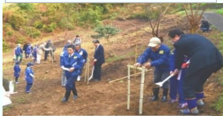
陽光桜植樹式(北吉田側) (2014年2月2日撮影)