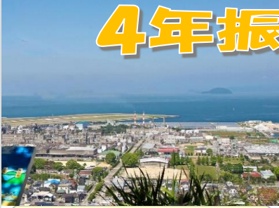
垣生山山頂からの眺望!