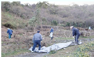
陽光桜植樹場所開墾(北吉田側) (2013年12月28日撮影)