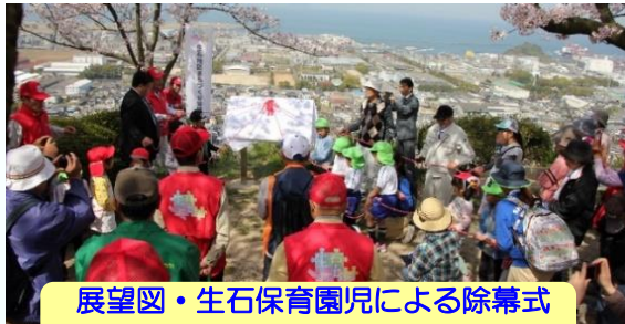
展望図・生石保育園児による除幕式 (2018年3月31日撮影)

生石地区まちづくり協議会は、来年発足後10年の節目を迎えます。当協議会では生石地区のシンボル、垣生山の里山化をめざして取り組んできました。地権者さまのご理解、ご協力を得て、高岡側、北吉田側の登山道入り口付近の一角に陽光桜を植樹して、いまでは見事な花を咲かすまでに成長。ここ3年あまりはコロナ禍で閉ざされた日常をエンジョイすべく、垣生山に足を運ぶことを日課？としている近隣地域の皆さんを始め、山頂からの眺望を求めて訪れる地区外からの登山者も多く、気軽にカメラ片手に登れる人気のスポットとなっています。