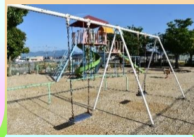
綺麗に整備された園内