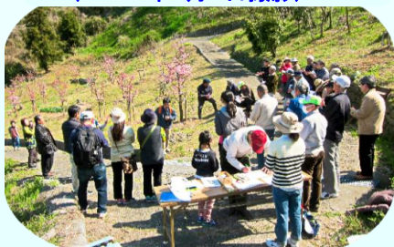
第1回陽光桜を見る会 (2016年3月26日撮影)

生石地区まちづくり協議会では発足当初から力を入れて整備してきた垣生山。ゆかりのある陽光桜など、桜のきれいな時期に、垣生山全体のドローン撮影を行い、編集後10周年記念式典でお披露目した後、一般公開も行う予定です。