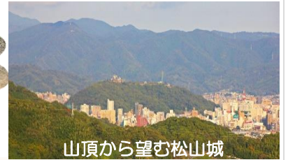
山頂から望む松山城

東に目を向ければ、石鎚山系の山々、初日の出を楽しむ登山者数は年々増加傾向！左側前方には松山城も見えます！