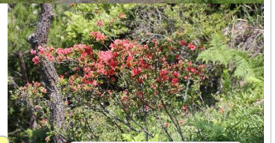
野生のヤマツツジ