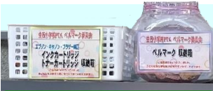
インクカートリッジ・ ペルマーク回収Box

生石公民館玄関には「使用済みインクカートリッジ」「小型家電」。ロビーには「古着」の回収ボックスが設置してあります。公民館が開館している時間内であればいつでも投函できます。私たちが個人で取り組めるSDGs！ぜひご協力、ご活用をお願いします。