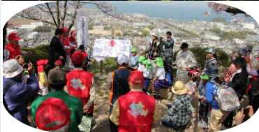
生石保育園児による展望図除幕式（2018. 3. 31）

春には垣生山の中腹部に植樹した陽光桜（高岡側、北吉田側共に）が一足早く開花し、公園管理協会の皆さんの手で綺麗に手入れされた山頂公園には、ソメイヨシノが公園を埋め尽くします。山頂を吹き抜ける風は素肌に心地よく心をも癒してくれます。