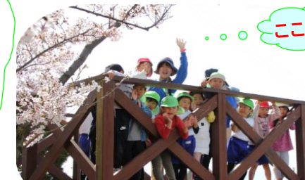
頂上展望 2018. 3. 31（撮）

登山に訪れた皆さんにご協力を仰ぎ、9.75トン（軽四トラック13台分を延べ人数1600人の手で！）の真砂土を頂上ステーションに運んでいただき、有効活用中です。ご協力いただきました皆さん本当にありがとうございました。感謝！感謝です。