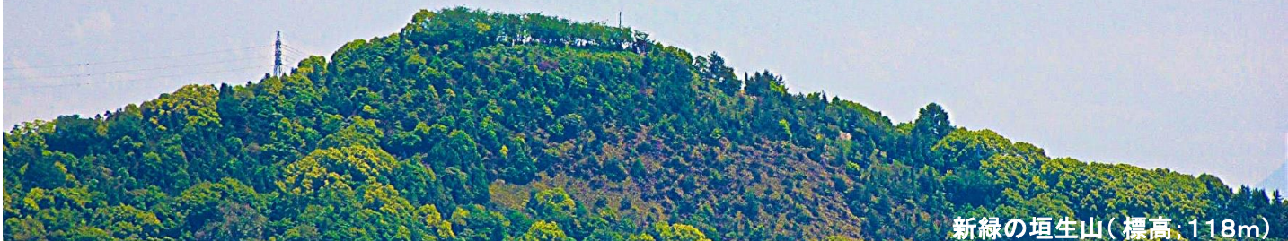
新緑の垣生山(標高:118m)