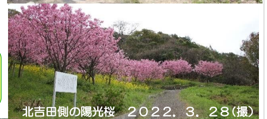
北吉田側の陽光桜 2022. 3. 28（撮）