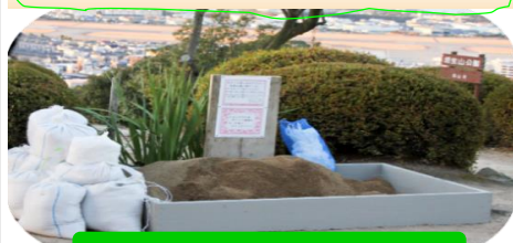
山頂の真砂土ステーション

山頂からの景観は抜群！西には、瀬戸内海が広がり海に浮かぶ島々、そこに沈む夕日はまた格別！松山空港を離発着する飛行機、その光景はカメラマンを虜にします。