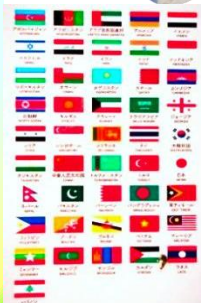
頂上までの道のりを各国の国旗とことばで表記！