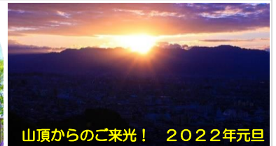
山頂からのご来光！ 2022年元旦

東に目を向ければ、石鎚山系の山々、初日の出を楽しむ登山者数は年々増加傾向！左側前方には松山城も見えます！