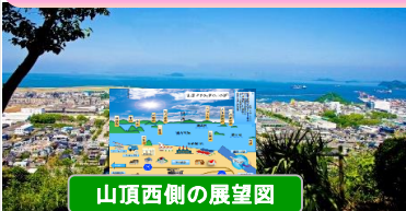
山頂西側の展望図