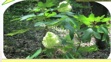
高岡側登山道沿いに咲く紫陽花